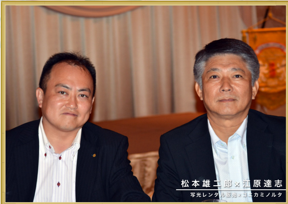
松本雄二郎×江原達志 写光レンタル販売×コニカミノルタ