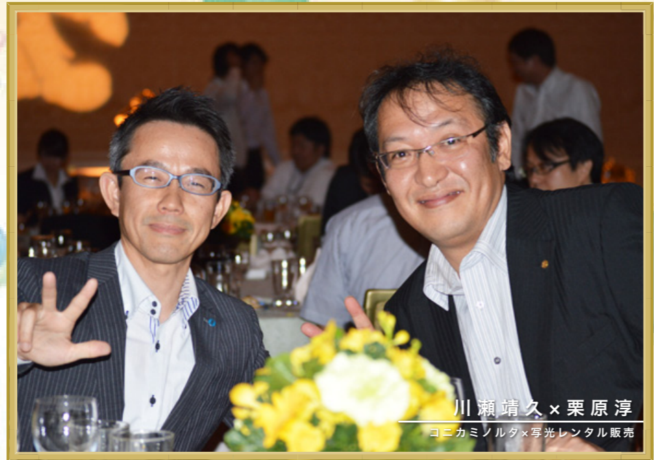
川瀬靖久×栗原淳 コニカミノルタ×写光レンタル販売